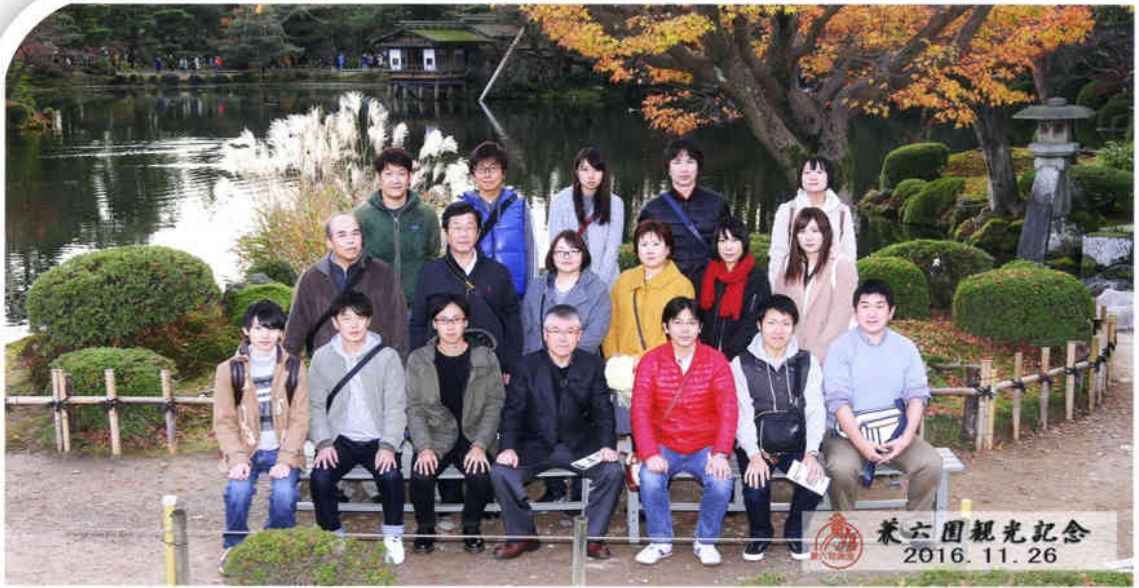
株式会社エスカム 社員旅行